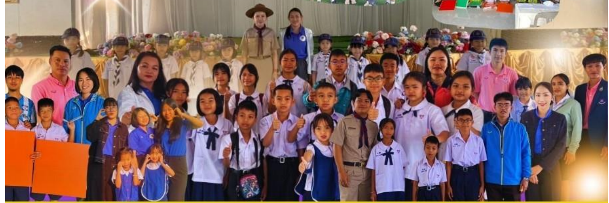
งานประชาสัมพันธ์โรงเรียนอนุบาลสังคม โรงเรียนอนุบาลสังคม สพป.หนองคาย เขต 1