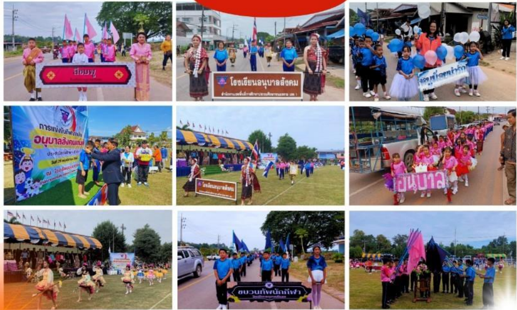
โรงเรียนอนุบาลสังคม สพป.หนองคาย เขต 1